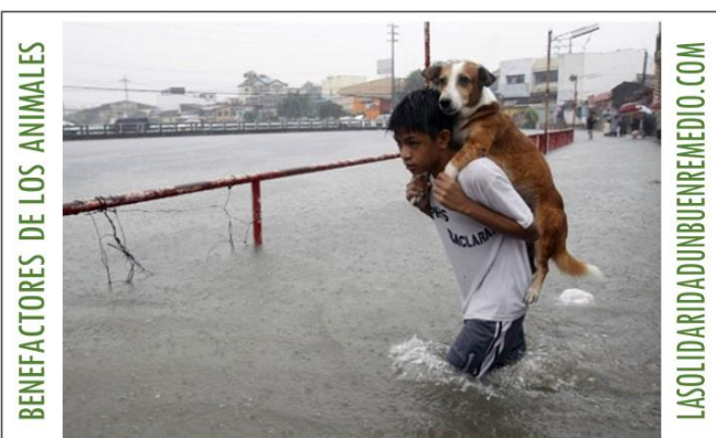
Un niño lleva en la espalda un perrito que quedó atrapado durante las inundaciones de Manila, Filipinas.