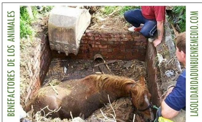
Liberan un caballo que había quedado atrapado en un pozo lleno de fango.