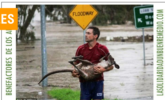
Un hombre rescata de las aguas un canguro durante las inundaciones de Ipswich, Australia.