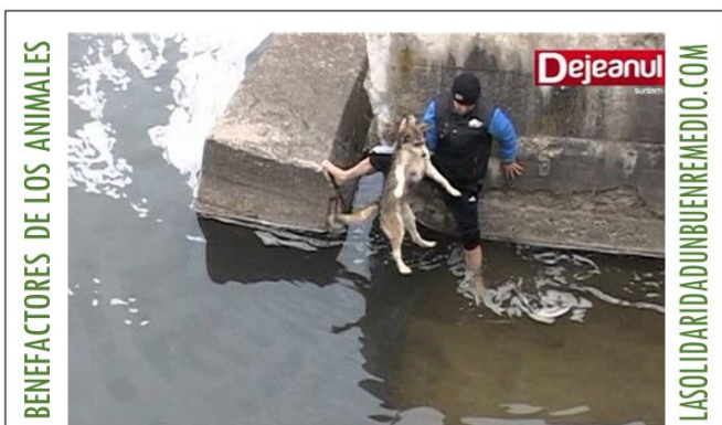
Rescate de un perro que había caído a un río casi helado.